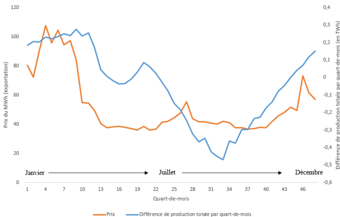
Figure 3. Évolution moyenne des prix à l'exportation par quart-de-mois et différence de production par quart-de-mois entre le scénario What-if # 2 et le scénario de référence.

Le graphique de la figure 3 présente la variation totale de la production par quart-de-mois pour le scénario What-if # 2 de même que l'évolution moyenne du prix de l'électricité sur le marché de l'exportation. On peut voir avec la courbe en bleu que pour plusieurs quart-de-mois, particulièrement dans les premiers et les derniers, la différence de production entre le scénario What-if # 2 et le scénario de référence est positif ou autrement dit, que pour ces périodes le débit est plus élevé que dans le scénario de référence. On peut voir également que pour ces périodes de débit plus élevé les prix à l'exportation sont relativement plus élevés. Ainsi, les hausses de débits anticipées surviennent davantage en période hivernale alors que le prix de l'électricité est plus élevé. Donc, même si globalement le scénario What-if # 2 envisage une baisse globale de la production sur 50 ans, la combinaison des variations de débits par rapport au niveau de référence et de la variation des prix d'exportation permet des gains monétaires.